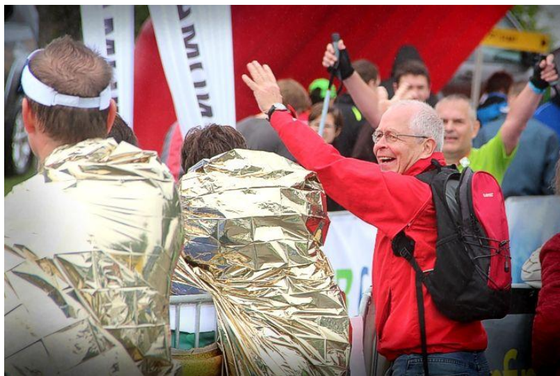
Beim Seenlandmarathon gab es für alle Teilnehmer Gold im Ziel!