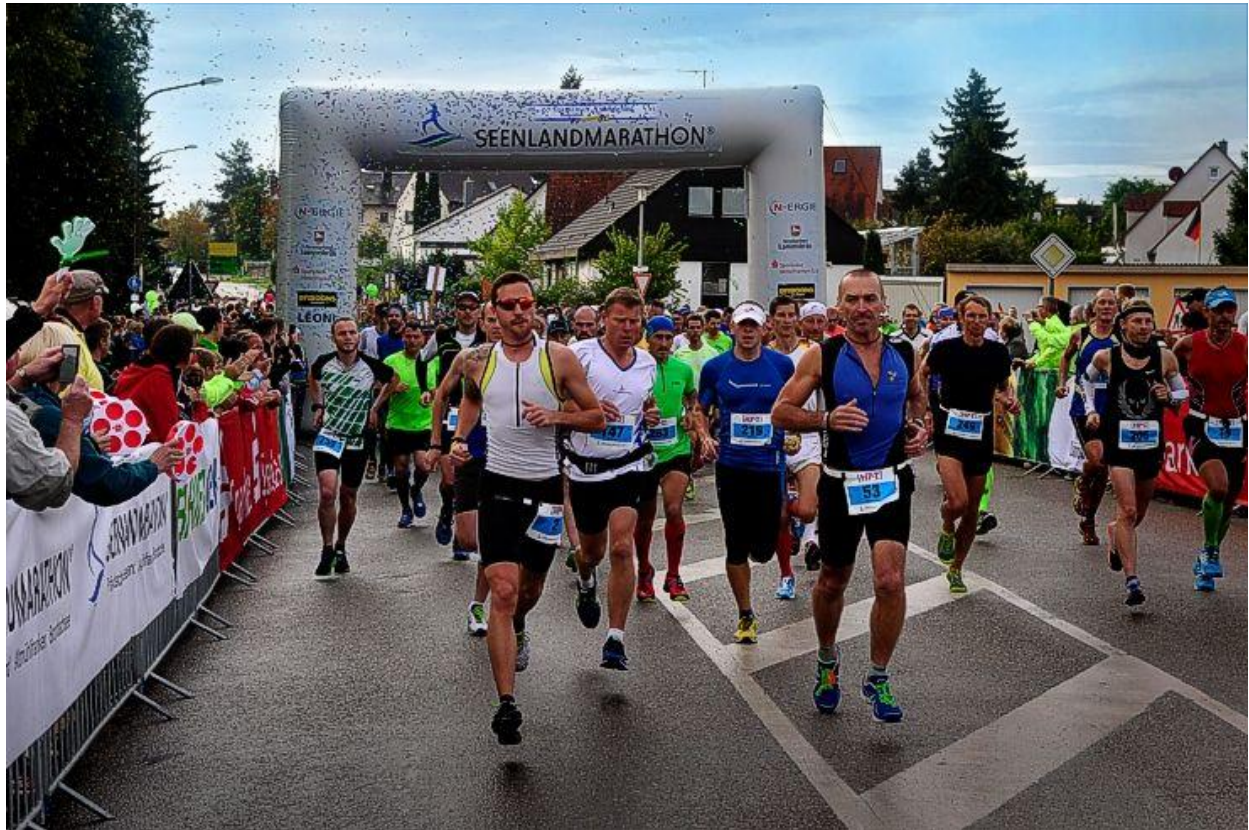
Der Seenlandmarathon in Pleinfeld am Brombachsee